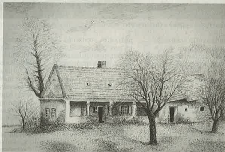
Tanya na Žitnom ostrove. Autorom kresby je József Erős.

víja majestátna jablň, blízko pri zemi na zhrubnutom kmeni vidno, ako ju ktosi zaštepil. Má vyše 100 rokov a radí sa k mimoriadne zriedkavej odrode Ďatlovské. Takéto stromy sú na celom svete možno už iba tri. „Usušené jablčko chutí ako datle. Má výraznú kvetinovo sladkú chuť, možno až príkru, pripomína tropické plody,“ opisuje. Prečo tento klenot neponúknuť spracovateľom ovocia, výrobcom ovocného pyré?