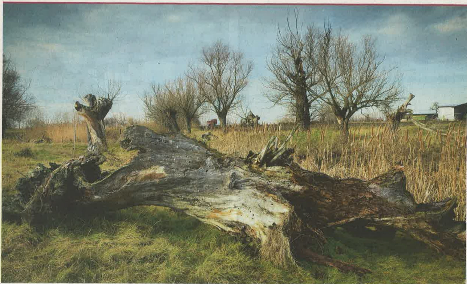
Staré vrby dodnes lemujú historické meandre na Žitnom ostrove. Ľudia tu začali dosádzať nové.