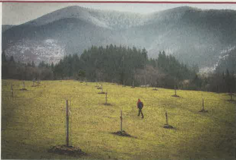
V mladom sade pod Kľakom sa pasú aj včely.